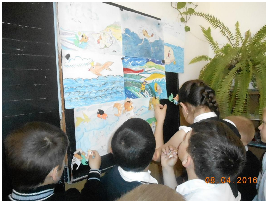
Сценка по сказке А.С. Пушкина «Сказка о золотой рыбке»